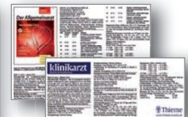
Titel- und Verlagslogo zum Eintrag